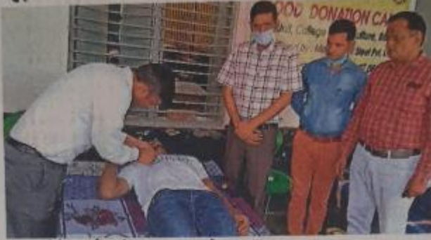
ब्लड डोनेशन कैंप में रक्तदान करते युवा।