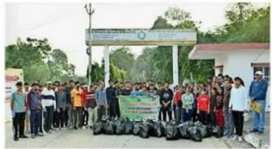
कृषि कॉलेज बावल के विद्यार्थियों ने एकत्रित किया प्लास्टिक का कचरा।