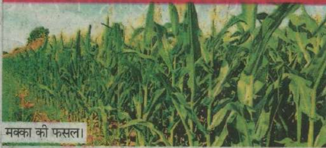
मक्का की फसल।

एक एकड़ खेत के लिए 8 किलोग्राम बीज की आवश्यकता होती है। मक्का में फॉल आर्मीवर्म फॉ सर्वाधिक हानिकारक कीट है फॉ की रोकथाम के लिए क्लोरट्रानिलीप्रोल 19.8: थायमेथोक्सम 19.8: कीटनाशी द्वारा 6 मिलीलीटर प्रति किलोग्राम