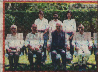
कुलपति के साथ चयनित विद्यार्थी।