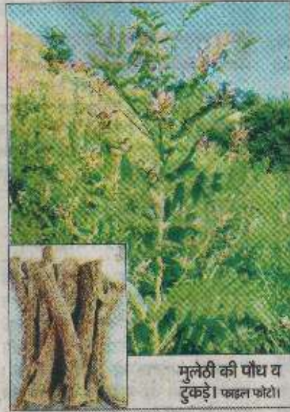
मुलेठी की पौध व टुकड़े। फाइल फोटो।