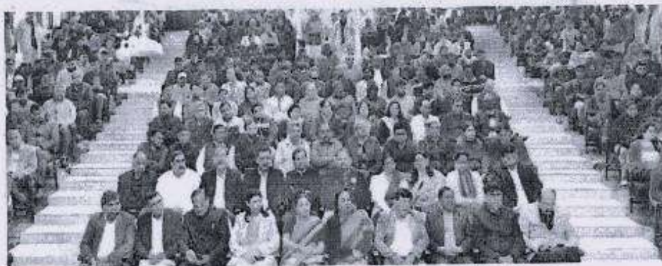
विश्वविद्यालय के 56वें स्थापना दिवस कार्यक्रम में उपस्थित श्रोतगण।