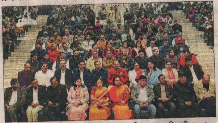
एचएयू में स्थापना दिवस पर आयोजित कार्यक्रम में उपस्थित स्टाफ व विद्यार्थी।

उन्होंने विश्वविद्यालय द्वारा गत वर्ष में अधिक उत्पादन देने वाली विभिन्न फसलों की उन्नत किस्में, समेकित कृषि प्रणाली के मॉडल,