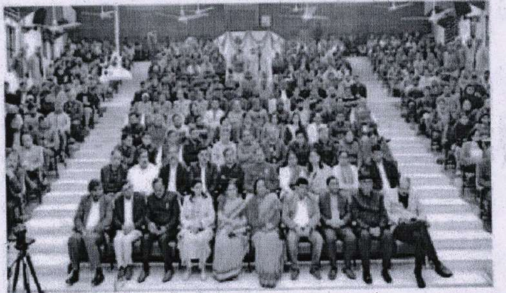
विश्वविद्यालय के 56वें स्थापना दिवस कार्यक्रम में उपस्थित श्रोतागण।