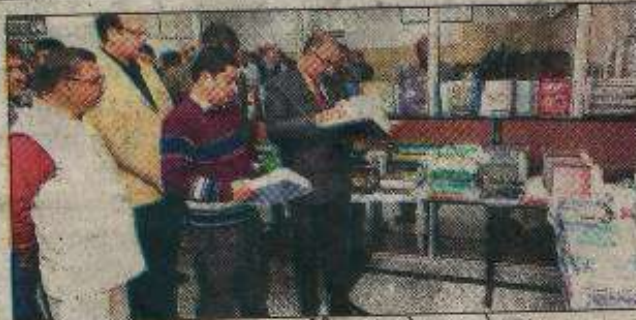
हिसार। विधि के कुलपति पुस्तक प्रदर्शनी का अवलोकन करते हुए।