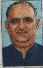
प्रबंधन मंडल की बैठक में लिया गया फैसला