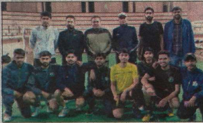
बैडमिंटन टीम के खिलाड़ी अधिकारियों के साथ।

हिसार, 23 जनवरी (विरेंद्र वर्मा): चौधरी चरण सिंह हरियाणा कृषि विश्वविद्यालय में आयोजित इंटर कॉलेज बैडमिंटन प्रतियोगिता में कॉलेज ऑफ एग्रीकल्चर बावल (लड़के) तथा कॉलेज ऑफ एग्रीकल्चर हिसार (लड़कियाँ) की टीमों ने उत्कृष्ट खेल का प्रदर्शन करके मैच जीत लिया।