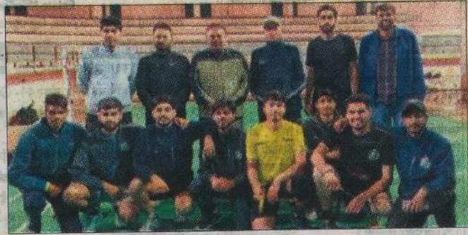
हिसार में बैडमिंटन टीम के खिलाड़ी अधिकारियों के साथ।