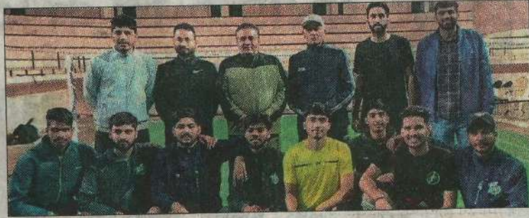
बैडमिंटन टीम के खिलाड़ी अधिकारियों के साथ।