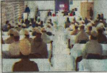
प्रशिक्षण कार्यक्रम में उपस्थित विश्वविद्यालय के कुलपति व अन्य अधिकारीगण