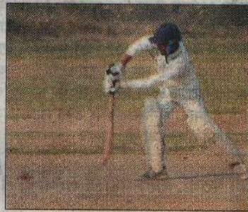
मैच में शॉट खेलता खिलाड़ी संवाद

सेमीफाइनल में बावल के कृषि महाविद्यालय को 92 रन से हराया