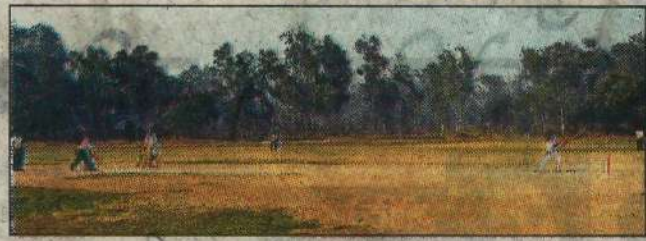
हिसार। क्रिकेट मैच के दौरान प्रतिभा का प्रदर्शन करते खिलाड़ी।