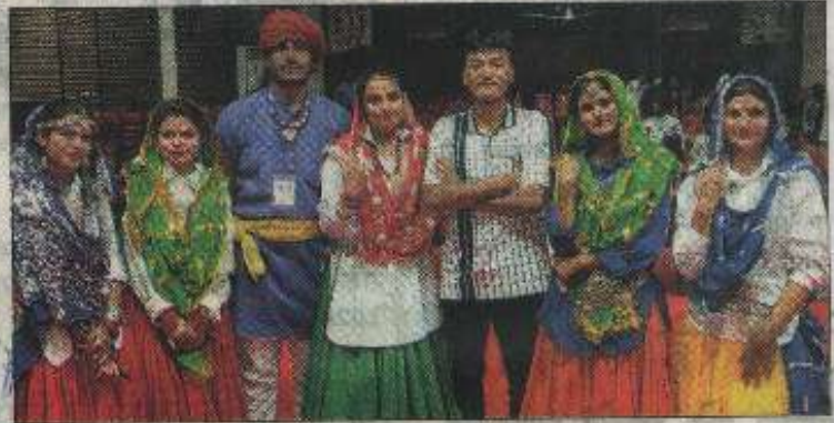
राष्ट्रीय एकता शिविर में सांस्कृतिक कार्यक्रम की प्रस्तुति देने वाले स्वयंसेवक।