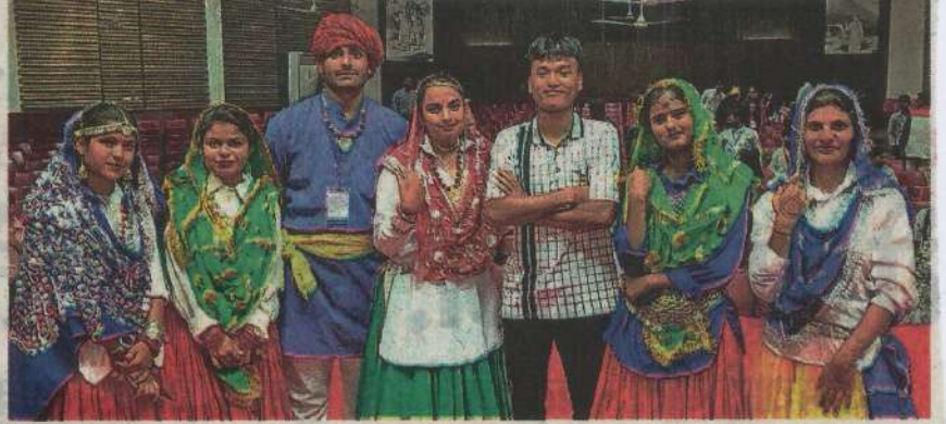
राष्ट्रीय एकता शिविर में सांस्कृतिक कार्यक्रम की प्रस्तुति देने वाले स्वयंसेवक।