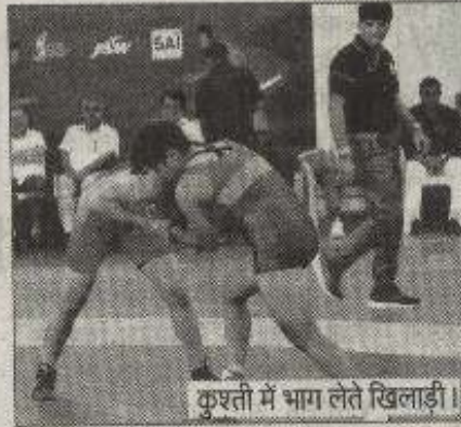
कुश्ती में भाग लेते खिलाड़ी।