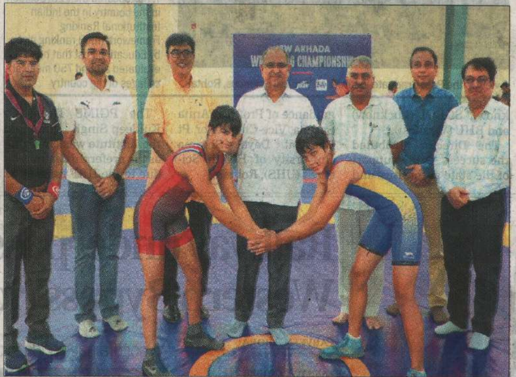
Players during the Jindal South West Arena Wrestling Competition at the Giri Centre of Chaudhary Charan Singh Haryana Agricultural University (HAU) on Thursday.

The JSW is organising a talent hunt competition for emerging wrestling players in the arenas located in Hisar district. Female players from various arenas are participating in this competition, with