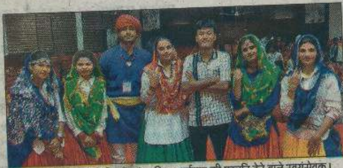
हिंसार। राष्ट्रीय एकता शिविर में सांस्कृतिक कार्यक्रम की प्रस्तुति देने वाले स्वयंसेवक।

हरियाणा कृषि विश्वविद्यालय में सात दिवसीय राष्ट्रीय एकता शिविर में संध्याकाल में विवि के कृषि महाविद्यालय सभागार में हरियाणवी सांस्कृतिक कार्यक्रम का आयोजन किया जा रहा है। जिसमें हरियाणा प्रदेश के स्वयंसेवकों ने हरियाणवी नृत्य, गायन व वादन में बेहतरीन प्रस्तुति देकर समां बांधा। स्वयंसेवकों ने अपनी प्रतिभा के माध्यम से लोकगीतों, वेशभूषा, संस्कृति का परिचय देकर 17 राज्यों से आए स्वयंसेवकों सहित अन्य दर्शकों को हरियाणवी संस्कृति से जोड़ा,