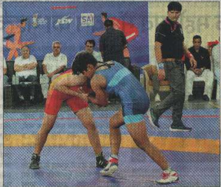
एचएयू के गिरी सेंटर में आयोजित कुश्ती प्रतियोगिता में भाग लेते खिलाड़ी।