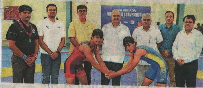
भास्कर न्यूज | हिसार

खेलों से अनुशासन व भाईचारे की भावना प्रबल होती है : वीसी