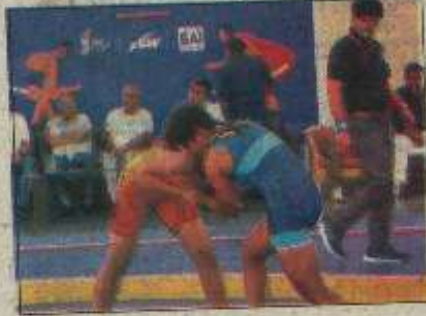
कुश्ती में भाग लेते खिलाड़ी