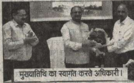
मुख्यातिथि का स्वागत करते अधिकारी।