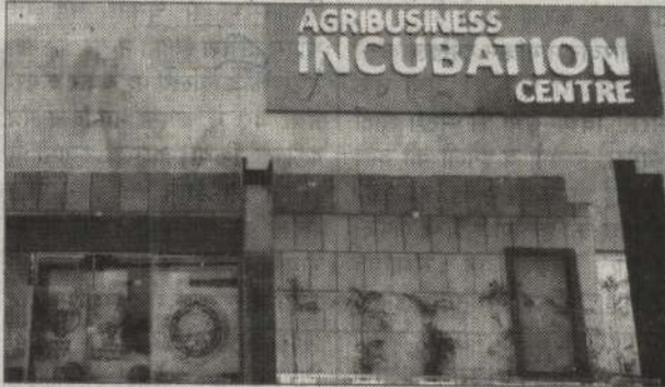
हिसार। विश्वविद्यालय में स्थित एबिक का फोटो