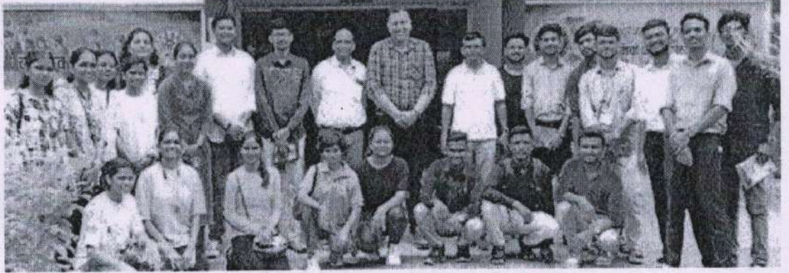
वैज्ञानिकों के साथ कृषि विद्यापीठ के विद्यार्थी

गौरतलब है कि एचएयू में खासतौर पर विद्यार्थियों के शैक्षणिक भ्रमण के लिए उनके यातायात, रहन-सहन, खानपान सहित सभी प्रकार की सुविधाओं के समुचित प्रबंध किए गए हैं। विद्यार्थियों के भ्रमण के दौरान देखने के लिए विश्वविद्यालय में हरियाणा कृषि पर्यटन केन्द्र, डॉ. मंगल सेन कृषि विज्ञान संग्रहालय, बायोटेक्नोलॉजी केन्द्र तथा फसल अवशेष प्रबंधन केन्द्र सहित अनेक