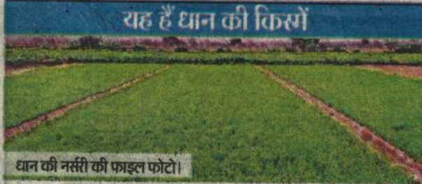
यह है धान की किस्में