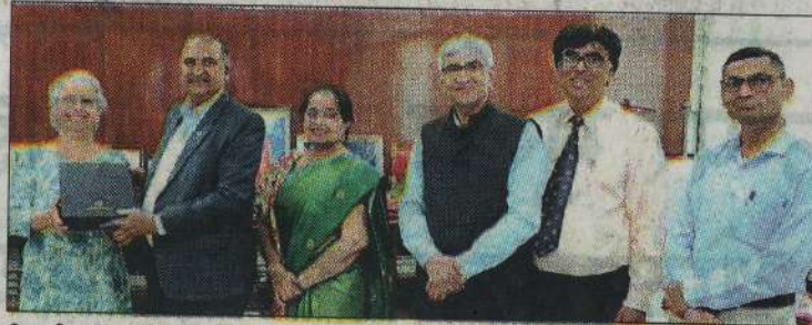
सिडनी यूनिवर्सिटी के प्रतिनिधियों को स्मृति चिह्न भेंट करते कुलपति प्रो. कांबोज। संस्थान