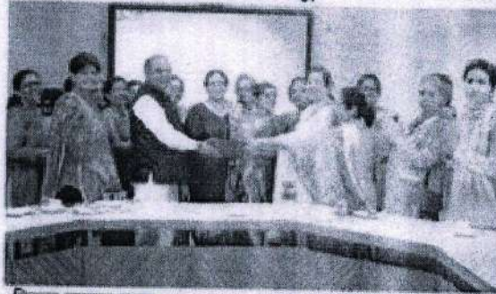
चिराग टाइम्स न्यूज