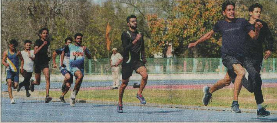
एचएयू के गिरी सेंटर में खेलकूद प्रतियोगिता में 200 मीटर की रेस में भाग लेते खिलाड़ी।