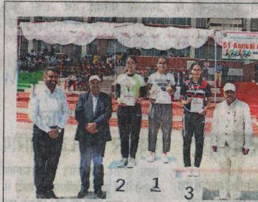
कुलपति के साथ मौजूद 1500 मीटर महिला दौड़ के विजेता खिलाड़ी।