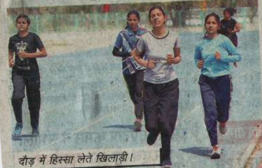
दौड़ में हिस्सा लेते खिलाड़ी।