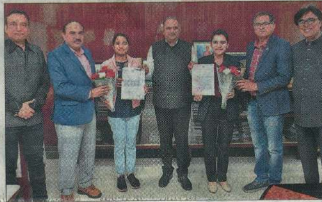
VC BR Kamboj with the students who were selected by the DRDO.