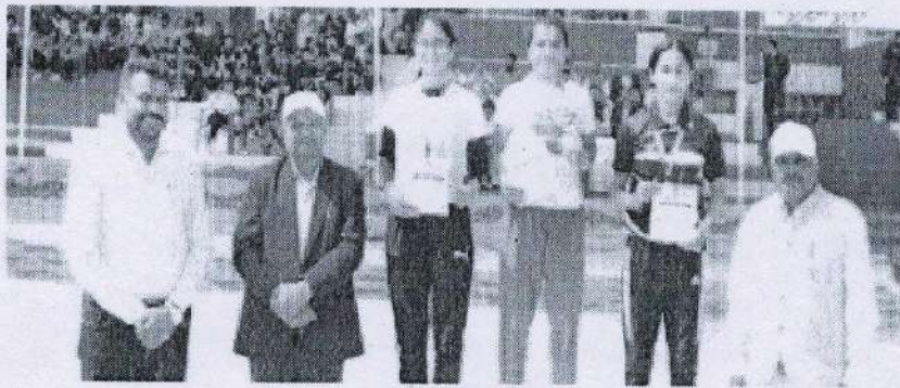
सम्मानिता सेते विजेता खिलाड़ी।

मुख्यअतिथि ने खिलाड़ियों का उत्साहवर्धन करते हुए कहा कि खेल ऐसा माध्यम है, जिससे हमारा सर्वांगीण विकास होता है। उन्होंने खिलाड़ियों से आह्वान किया कि वे दिनचर्या में खेलों को अपनाएं, यदि जीवन में सफल होना है तो हमें शारीरिक व मानसिक रूप से स्वस्थ होना अनिवार्य है। इस विश्वविद्यालय ने अनेक उच्चा दर्जे के खिलाड़ी दिए हैं, जिन्होंने राष्ट्रीय