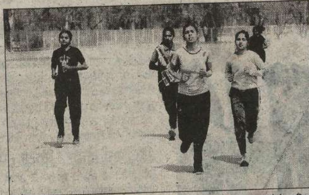
हिंसार। दौड़ में हिस्सा लेते छात्राएं।