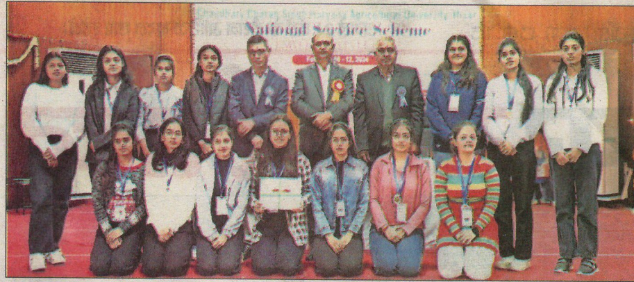
कार्यक्रम के दौरान प्रमाण-पत्र प्राप्त स्वयंसेवकों के साथ कुलपति।