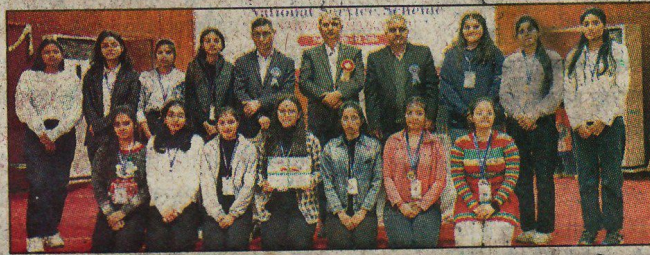
कार्यक्रम के दौरान प्रमाण-पत्र प्राप्त स्वयंसेवकों के साथ कुलपति।

उपलब्ध सुविधाओं का लाभ उठाते हुए अपने अंदर चरित्र निर्माण, व्यक्तिगत विकास, आत्मबिश्वास, नेतृत्व गुणों को पैदा करें, तभी वे