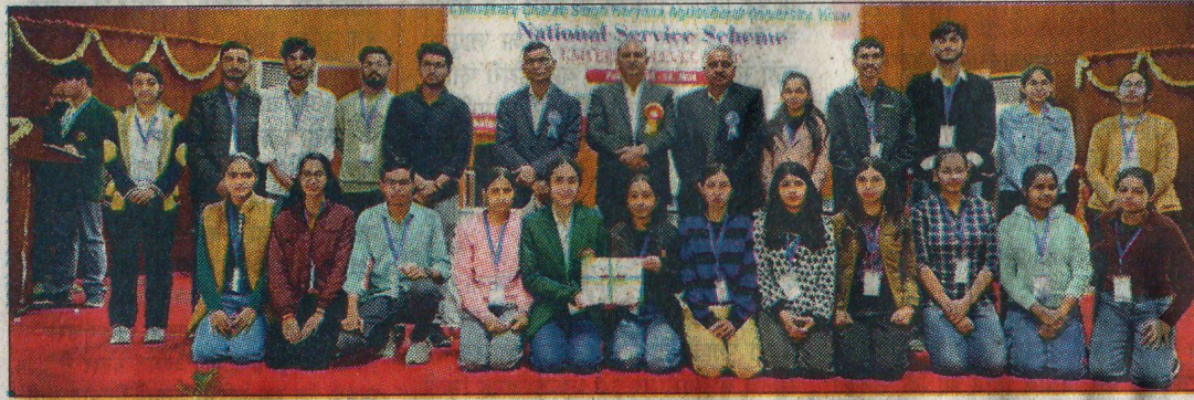
एचएयू में कार्यक्रम के दौरान प्रमाण-पत्र प्राप्त स्वयंसेवकों के साथ कुलपति।