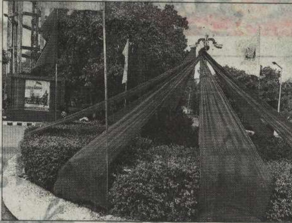
हिसार। विश्वविद्यालय में सजाए गए विभिन्न चौक।