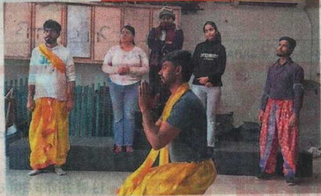
रामलीला मंचन की रिहर्सल करते कलाकार

जागरण संवाददाता, हिसार सियाराममय सब जग जानी ...। संपूर्ण देश श्रीराम के प्राण प्रतिष्ठा महोत्सव में रम गया है। श्रीकृष्ण की कर्मभूमि अर्थात् हरि की धरा भी राममय है...। जिधर देखिए मर्यादा पुरुषोत्तम के ही गुणगान ...। रविवार को श्रीराम के आदर्श जीवन का गुणगान और उसकी राममय गूंज हिसार में भी सुनाई देगी। श्रीराम के नाम की यह गूंज हिसार के हरियाणा कृषि विश्वविद्यालय स्थित कृषि महाविद्यालय सभागार में सुनाई देगी। 21 जनवरी को दैनिक जागरण के रामोत्सव की कड़ी में होने वाले रामलीला के मंचन में हिसार ही नहीं अपितु पूरे हरियाणा से 35 कलाकार भाग ले रहे हैं। ये अपनी शेररो-शायरी के माध्यम से श्रीराम जन्म से लेकर उनके अयोध्या वापसी तक का प्रसंग सुनाएंगे। यही