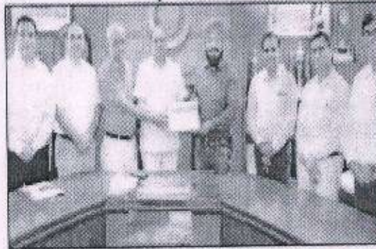
कार्यसूचक और विशेष सत्रों का आयोजन किया जाता है। उन्होंने बताया

फाइटोपैथोलॉजिकल सोसाइटी की बीच रोगजनक और रोग जांच समिति में 15 देशों से जुड़े सदस्य शामिल होते हैं, जोकि बीच रोग जनकों और उनकी कायम से संबंधित मामलों पर ध्यान देते हैं और बीच रोग जनकों के बारे में नई- नई जानकारी अनुसंधानी व प्रायोगिकों को एक-दूसरे से साझा करते हैं, जिसके लिए उपरोक्त सोसाइटी की ओर से वार्षिक संगोष्ठियां,