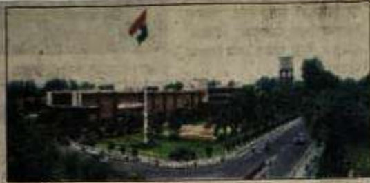
हिसार। हरियाणा कृषि विश्वविद्यालय का प्रशासनिक भवन।