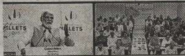
भास्कर-न्यूज़ | हिसार

एचएसू के वैज्ञानिकों और शोधार्थियों ने वर्चुअल माध्यम से ग्लोबल मिलेट कॉन्फ्रेंस में भाग लिया