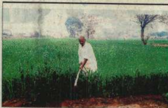
A farmer works in a field in Hisar village.

The Haryana Agriculture Department has set a target of a bumper production of 12.40