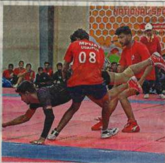
गिरी सेंटर में कबड्डी में भिड़ती बांदा व उदयपुर की टीम।