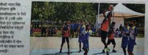
कबड्डी में बांदा ने उदयपुर को, उदयपुर ने जबरनपुर को, जालंधर ने मेरठ को हराया।

प्रदर्शन • फुटबॉल में सोलन यूनिवर्सिटी ने मुंबई को हराया। • बिहार यूनिवर्सिटी ने कोयंब को हराया। • कोयंबे केसी उदयपुर ने जौनपी कंग यूनिवर्सिटी को हराया कबड्डी • कबड्डी में बांदा ने उदयपुर को, उदयपुर ने जबरनपुर को, जालंधर ने मेरठ को हराया। जालंधर • जालंधर में फर नगर ने रावे को, कैलाशपुर ने भुवनेश्वर को, बीकानेर ने बलरघाट को हराया।