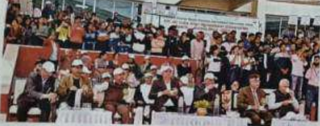
पहले दिन होल मुकाबलों के ये रहे परिणाम