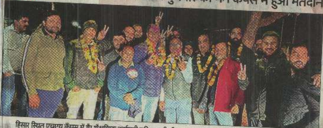
हिसार स्थित एचएयू कैंपस में गैर शैक्षणिक कर्मचारी यूनियन की जीत का जश्न मनाते प्रधान दिनेश के समर्थक। संवाद

एचएयू : मंगलवार को बाहरी कैंपस व बुधवार को मेन कैंपस में हुआ मतदान