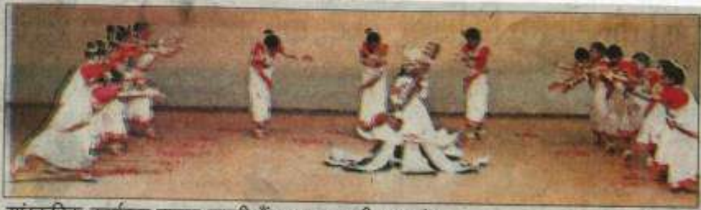
सांस्कृतिक कार्यक्रम प्रस्तुत करती कैंपस स्कूल की छात्राएं।