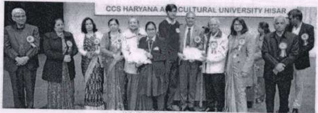
मुख्य अतिथि विद्यार्थियों को पुरस्कृत करते हुए।