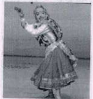
कार्यक्रम में प्रस्तुति देती छात्रा।

विद्यालय के छात्र-छात्राओं द्वारा अति सुंदर सांस्कृतिक कार्यक्रम प्रस्तुत किया गया, जिसमें हरियाणवी नृत्य, पंजाबी नृत्य, भराठी नृत्य, वायोगैस से संबंधित नुकड़ नाटक आदि का मंचन किया गया। समारोह में विश्वविद्यालय के विभिन्न महाविद्यालयों के गणमान्य अधिकारी, अभिभावकगण व अन्य अतिथिगण उपस्थित थे।