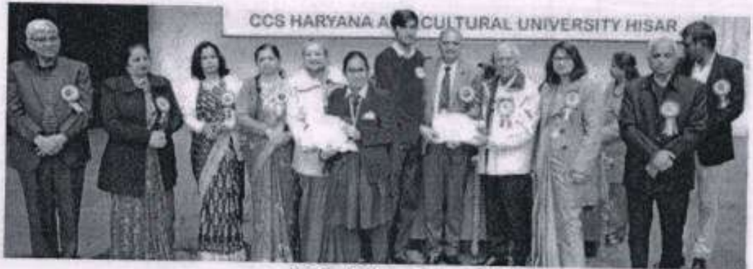
मुख्य अतिथि विद्यार्थियों को पुरस्कृत करते हुए।