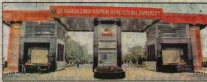
हरियाणा कृषि विश्वविद्यालय का दृश्य।