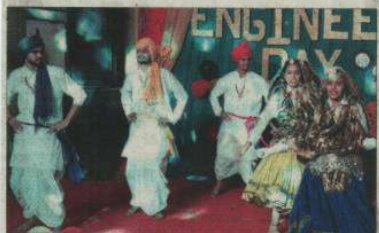
एचएयू में इंजीनियर डे के मौके पर सांस्कृतिक कार्यक्रम प्रस्तुत करते विद्यार्थी। संजय