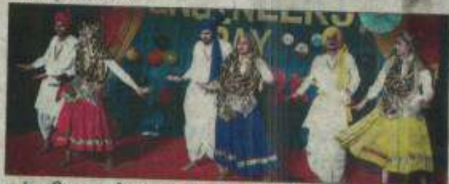
सांस्कृतिक कार्यक्रम प्रस्तुत करते विद्यार्थी

प्रबंध के साथ-साथ कृषि उत्पादन बढ़ाने में महत्वपूर्ण भूमिका निभाई है लेकिन अभी भी कृषि में बहुत कमीतियां हैं जिनसे निपटने के लिए उनके योगदान की आवश्यकता है।