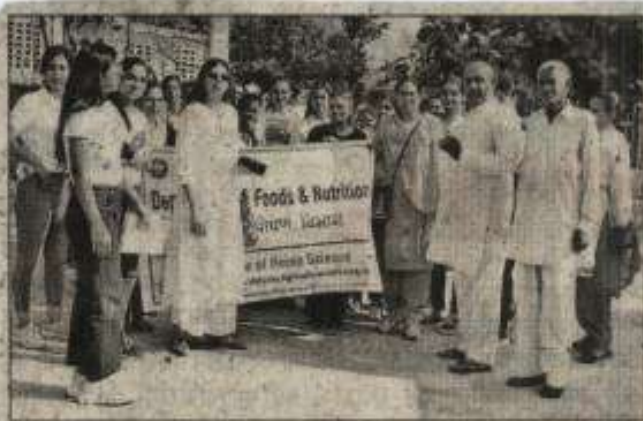
हिसार। गांव में रैली में भाग लेती छात्राएं।