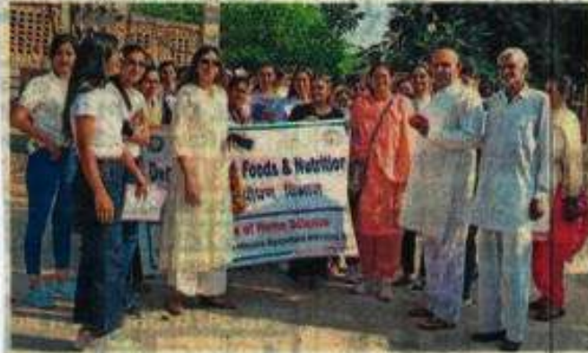
गांव में रैली में भाग लेती छात्राएं।