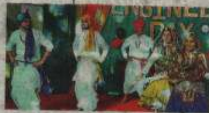
एचएयू में कार्यक्रम प्रस्तुत करते हुए विद्यार्थी।