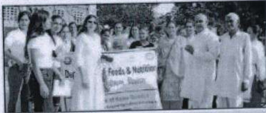
गांव में रैली में भाग लेती छात्राएं।