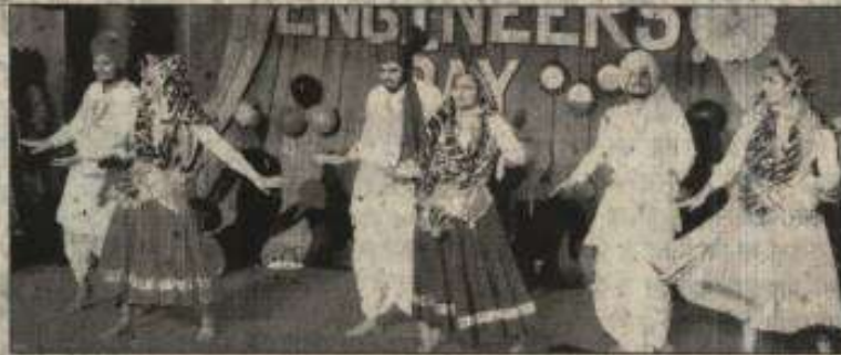
हिंसार। सांस्कृतिक कार्यक्रम प्रस्तुत करते विद्यार्थी।