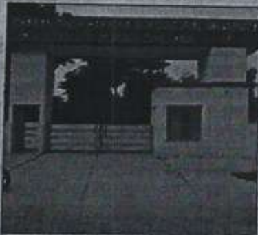
कौल स्थित चौ. चरण सिंह कृषि महाविद्यालय।