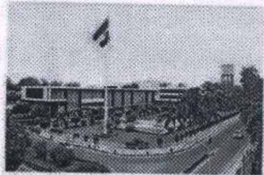
चौधरी चरण सिंह हरियाणा कृषि विश्वविद्यालय के प्रशासनिक भवन का फाइल फोटो।