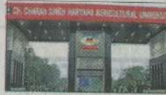
एचएयू का गेट नंबर चार। संवाद

इंस्टीट्यूट ऑफ बिजनेस मैनेजमेंट एंड एग्जीक्यूटिव गुरुग्राम में एमबीए