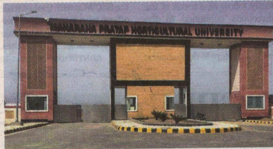
FOUNDATION LAID IN 2016

So far, only the boundary wall and entry gate has been constructed, while the work is going on for polyhouse and pre-engineering structural buildings to run the classes of BSc (horticulture) from July, which are at present being run from the building of the Extension Education Institute, Nilokheri.